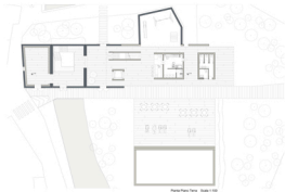
Piano Piano Terra Scala 1:100