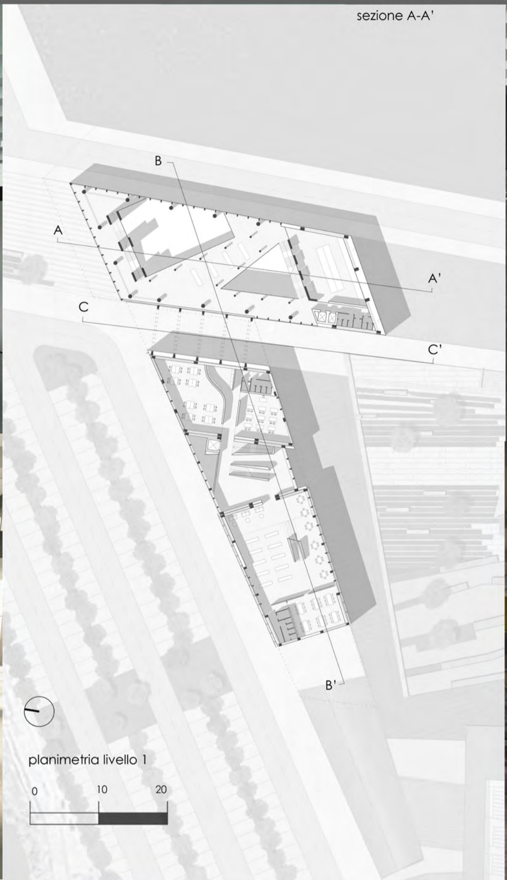
planimetria livello 1